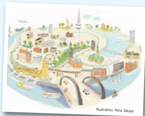
Illustration: Nina Takata

Mitveranstalter: www.sme-jugendhilfezentrum.de